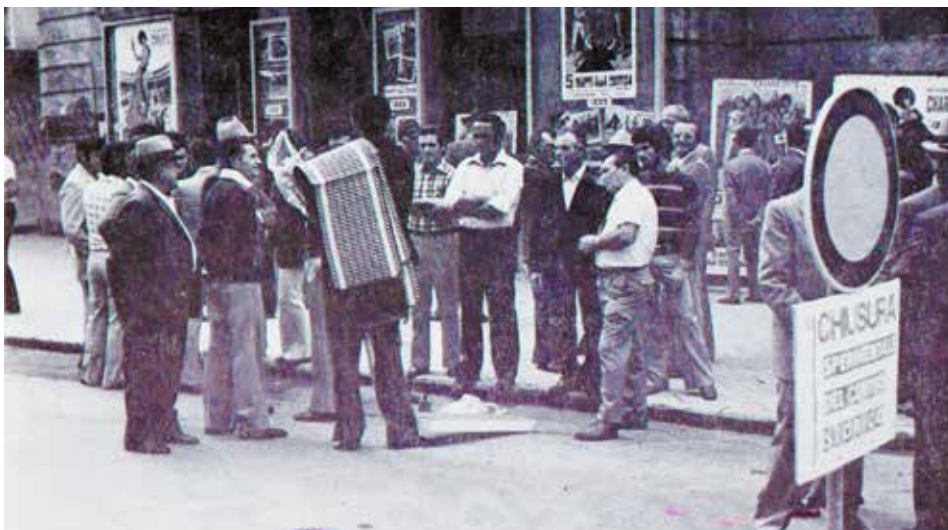
Anno 1974: davanti al Teatro Comunale si commenta la chiusura del centro storico