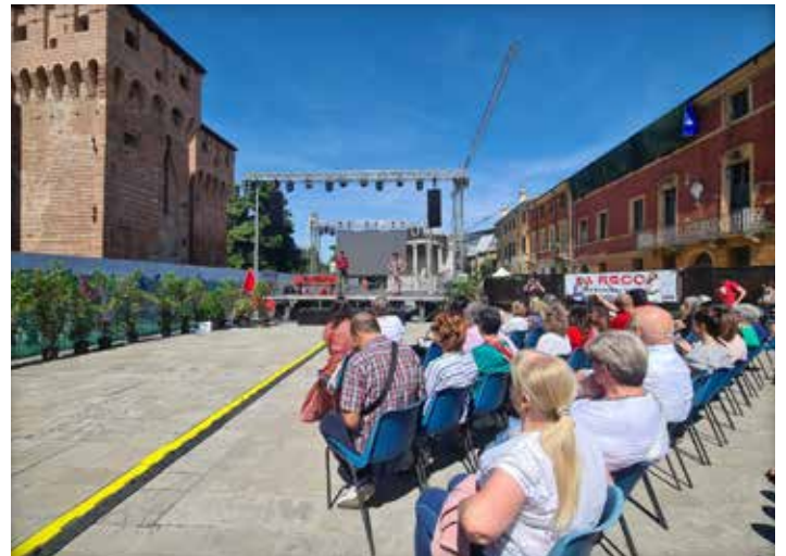
Nella foto di Giorgio Bocchi la manifestazione spontanea che si è svolta a San Felice lo scorso 15 giugno

Nuovo servizio dallo scorso 26 giugno a San Felice