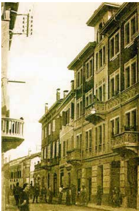
Il nostro centro storico, verso la fine degli anni '30: il celebre palazzo Malagoli di via Mazzini, allora via Umberto I°

La piccolissima bottega vendeva fiori e vasi: un commercio molto li-