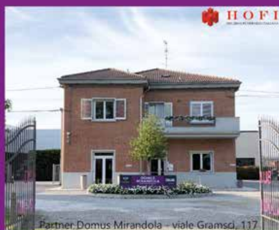
Partner Domus Mirandola - viale Gramsci, 117