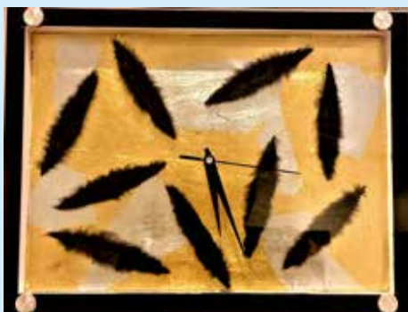
L'opera "Un orologio, un attimo o una vita" - foglia d'oro, argento e pelliccia artificiale.

Il titolo dell'opera esposta era "Un orologio, un attimo o una vita".