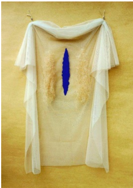
"Reliquia della Purezza" - 2022 Cm. 130 x 80 x 7, tela di organza bianca da sposa, cartapesta, blu lapislazzuli e paglia di plastica

L'artista sanfeliciano Domenico Difilippo ha partecipato alla IX Biennale d'arte contemporanea "Magna Grecia", che si è svolta dal 23 luglio al 20 agosto scorsi a Cosenza, con due opere recenti della serie "Reliquiari": "Reliquia della Purezza" e "Reliquia del Comando". Difilippo, nato a Finale Emilia nel 1946, vive e opera a San Felice sul Panaro, ed è stato uno dei massimi esponenti di "Arte Fantastica" in Italia negli anni Settanta e Ottanta. È stato fondatore di un nuovo movimento artistico: "Astrattismo Magico" lanciato in Germania nel 1991 a Brema che gli è valsa un'esposizione in anteprima per l'Italia a Palazzo dei Diamanti a Ferrara. Vincitore di concorsi ministeriali per enti pubblici, per meriti artistici è stato nominato dal Ministero dell'Università a metà anni Novanta docente nelle più prestigiose accademie di Belle Arti italiane: Firenze, Sassari, Venezia, Carrara, Milano/Brera e a Bologna dove ha concluso il suo percorso alla docenza nell'accademia felsinea in qualità di vicedirettore. Nella primavera del 2019 è stato premiato alla carriera quale "Artista di chiara fama" al premio Gino De Agrò nella città di Troina in Sicilia, sottolineando che il maestro Domenico Difilippo è tra i pochi a realizzare le sue