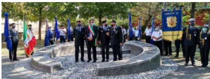
Nella foto una delle passate commemorazioni dell'ammiraglio Carlo Bergamini