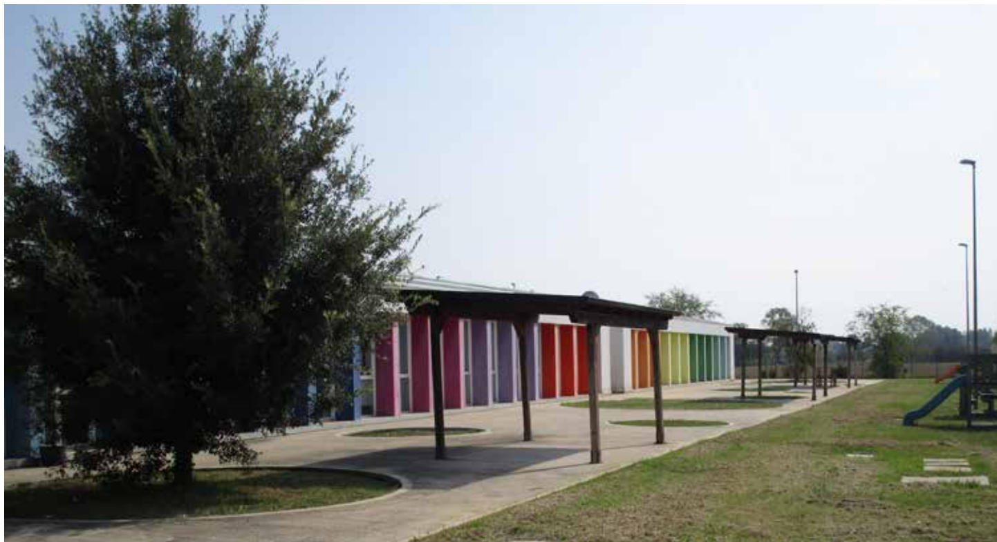
Nido di via Montalcini di San Felice sul Panaro

Per l'anno educativo 2022/2023, i nidi d'infanzia pubblici zero/tre anni sono affidati alla gestione dell'Azienda Pubblica di Servizi alla Persona (Asp) dei Comuni Modenesi Area Nord. Oltre al nido Panda di Medolla, in capo ad Asp da diversi anni, si sono aggiunti da quest'anno educativo i nidi: Arcobaleno di Concordia, Il Paese dei Balocchi di Mirandola, Le Farfalle di San Prospero e i servizi educativi di San Felice sul Panaro, che includono il nido, la sezione Primavera e lo spazio bimbi "Hakuna Matata".