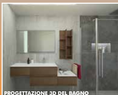
PROGETTAZIONE 3D DEL BAGNO