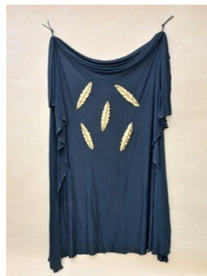
"Reliquia del Comando" - 2022 Cm. 157 x 66 x 6, tela di cotone nera, cartapesta e foglia d'oro.

tali scopi. In proposito Difilippo ha ricordato come: «La cultura e l'arte viva siano utili alla sanità della mente». Nel suo percorso artistico ha affiancato alla sua attività la direzione della Biennale d'Arte "Aldo Roncaglia" per 25 anni, realizzando per le Raccolte Civiche di Arte Contemporanea di San Felice sul Panaro, opere di maestri e giovani artisti emergenti, Tante sono le rassegne e pubblicazioni di livello nazionale e internazionale che lo fanno un completo artista e un fine intellettuale.