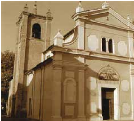
La chiesa viene chiamata tradizionalmente del Molino, per la vicinanza al mulino ad acqua che si trovava anticamente sul vicino corso del canale Canalino, ma è dedicata a San Giuseppe. Fu edificata nel 1425. Ampliata ed abbellita nel '600, fu poi soppressa in epoca napoleonica e riaperta al culto nel 1878. È stata gravemente danneggiata dal sisma del 2012.

I “bòtt”: sapete che cosa sono e a che cosa servono? Tante persone, alle quali rivolgo questa domanda, sembrano cadere dalle nuvole, non conoscono le regole dei cosiddetti “bòtt”. E quello che mi fa più specie è che sia la gente di una certa età a ignorarle; non mi meraviglio se non lo sanno i giovani. Quando il campanaro annuncia con il suono delle campane la morte di qualcuno, finita la «passata» così diciamo a San Felice, dopo una breve pausa, suona i “botti”. Questo lo fa, per più volte, servendosi di tre campane con suono diverso uno dall'altro. Questi tocchi di campana hanno un preciso significato: un botto annuncia la morte di un bambino,