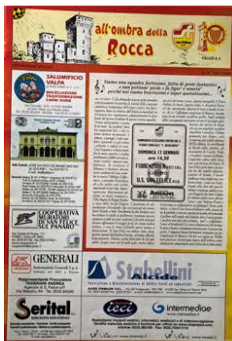
Un numero più recente del 2008