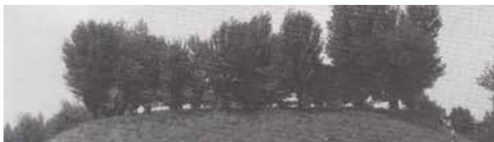
La Motta di Montalbano

Durante l'evento sarà presente un bookshop dove poter trovare le ultime pubblicazioni del Gruppo Studi Bassa Modenese. Per info e maggiori dettagli: Facebook.com/gruppostudibassamodenese; mail: gruppostudi@virgilio.it