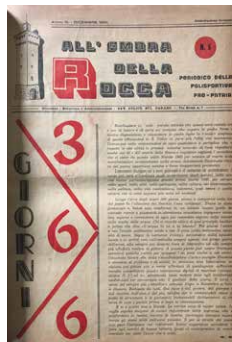
Il numero di dicembre 1960

Nel prosieguo degli anni la stampa passa all'odierna Sogari Artigrafiche di via dei Mestieri e si registrano diversi variopinti e ben riusciti contributi degli innamorati di sport diversi che hanno pubblicizzato le loro discipline preferite