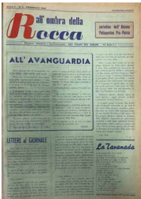
Il numero 3 di febbraio 1959

Il nome del giornale identificava il terreno di gioco sul quale allora si cimentava la squadra locale, il rettangolo verde dietro la Rocca