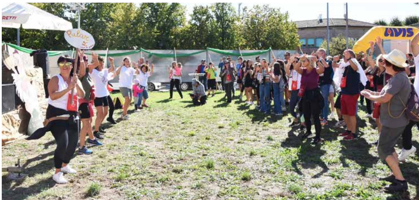
Un momento della manifestazione