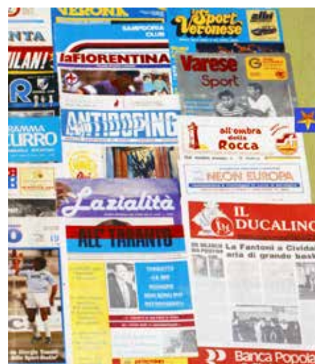
Nella foto "All'Ombra della Rocca" a pagina 29 del "Guerin Sportivo"