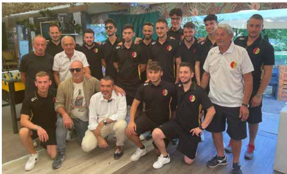
Presentazione ufficiale della squadra avvenuta a San Felice lo scorso 10 settembre