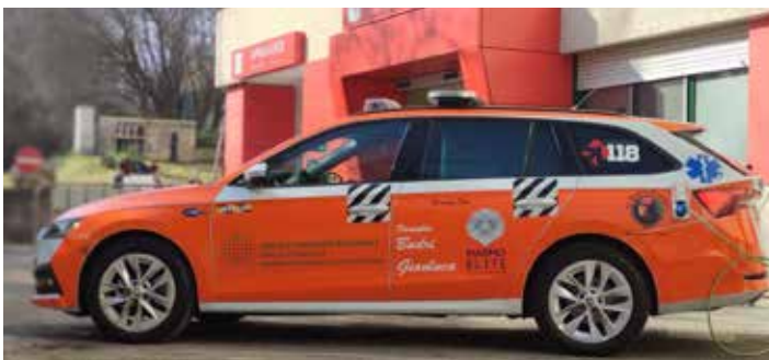
Mezzo di soccorso avanzato donato

«Il nuovo mezzo di soccorso avanzato donato ci ha permesso di sostituire un mezzo relativamente re-