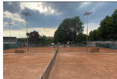
I campi in terra rossa

50 VETTURE KM ZERO VANTAGGI FINO A 7.000€