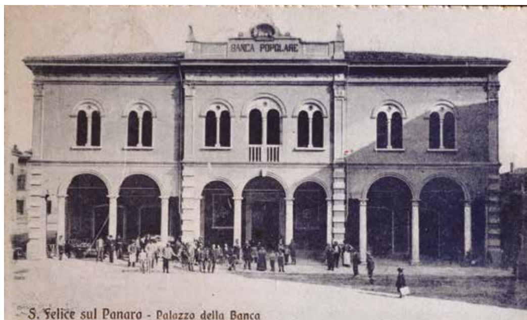
S. Felice sul Panaro - Palazzo della Banca