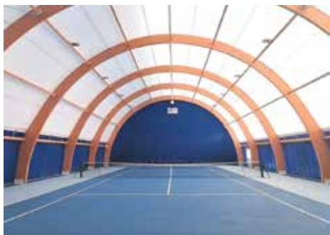
Il terzo campo con copertura permanente