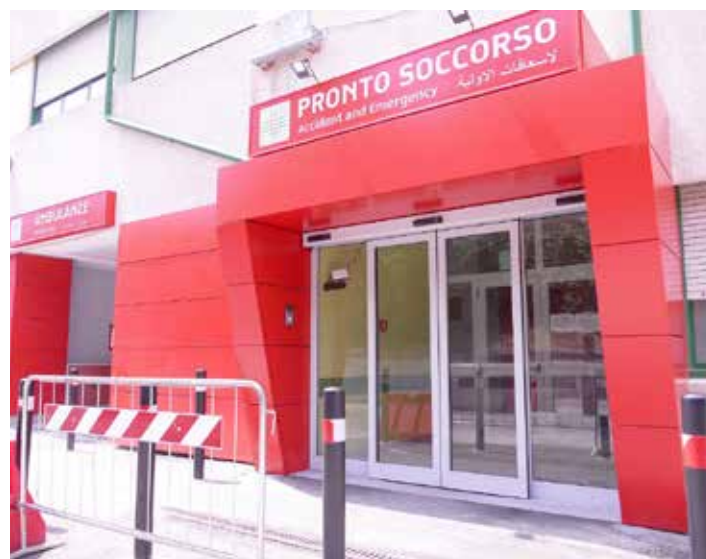
Ingresso Pronto Soccorso