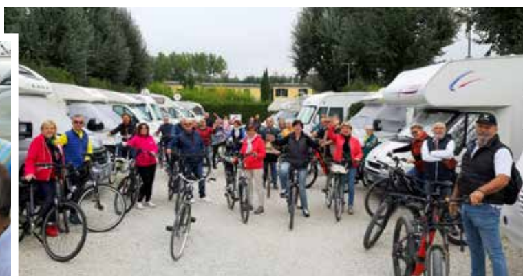
Partenza per escursione in città a Lucca