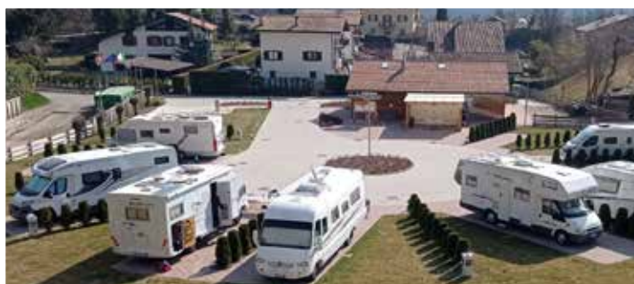
Primi arrivi a Covelo (TN)