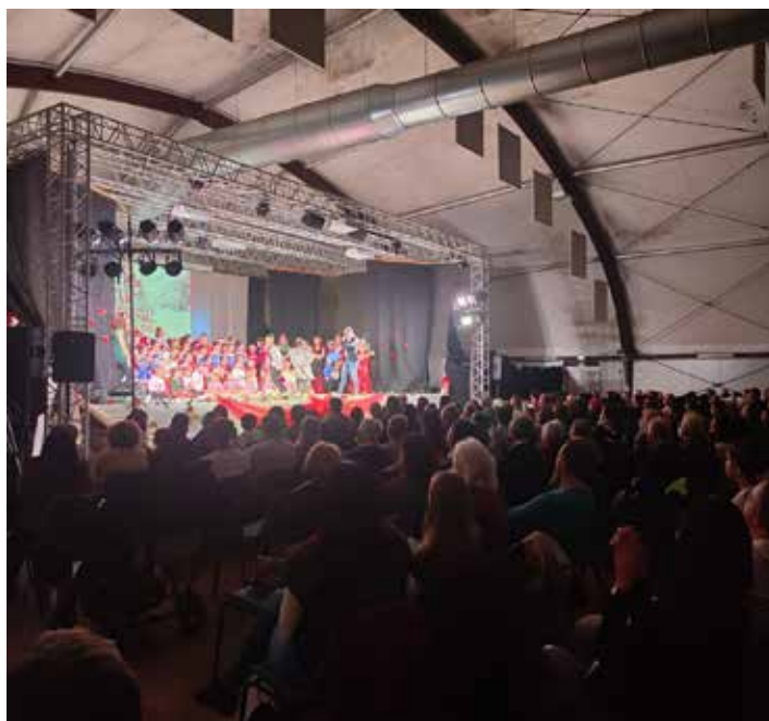
La festa della scuola di danza Arckadia.

Venerdì 23 dicembre altre suggestioni con "Accordi di pace & Young Guitar Orchestra", gli auguri di Natale della Pro Loco in collaborazione con la Fondazione scuola di musica "Andreoli" e i maestri Matteo Minozzi ed Eugenio Polacchini. Anche qui tanti applausi ed entusiasmo.