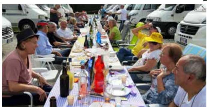
Pranzo della domenica autogestito