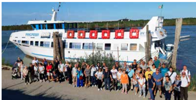
Raduno di Gorino, prima dell'imbarco per la minicrociera

Per il 2023 stiamo allestendo il calendario delle prossime iniziative, invitiamo quindi, tutti i possessori di camper che volessero far parte della nostra associazione a contattarci al numero 346/6033144.