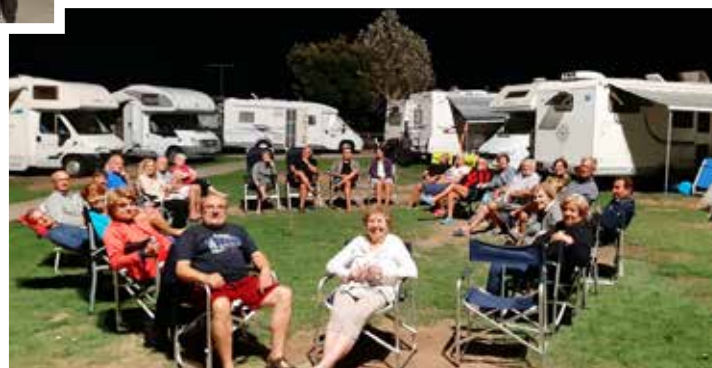
Due chiacchiere dopo cena