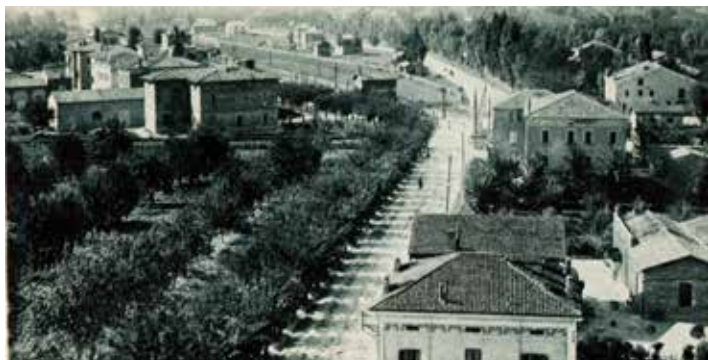
Il viale della stazione