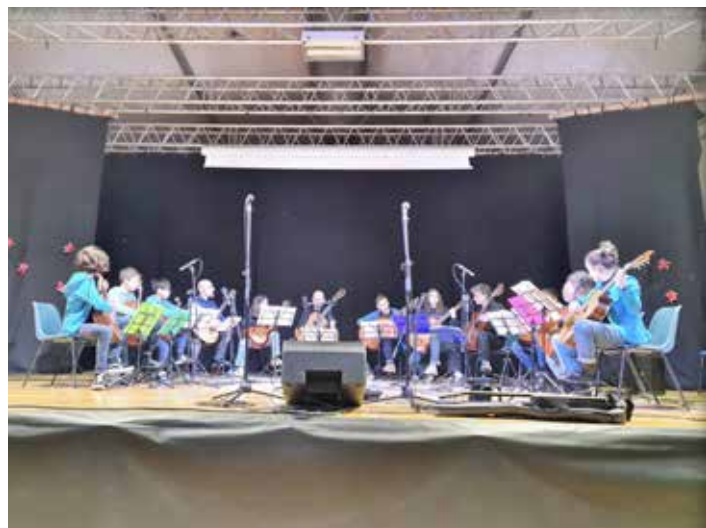
Il concerto degli auguri natalizi della Pro Loco