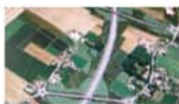
Il tracciato dell'auto