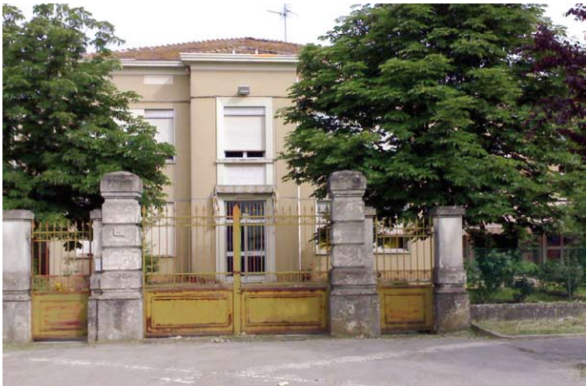
Ingresso IPAB "A. Modena"