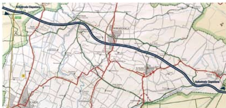
La Cispadana ridurrà di oltre il 50% i tempi per raggiungere le Autostrade A22 Modena - Brennero e A13 Bologna - Padova.

Il documento votato nel gennaio 2008 ha giudicato adeguata alle esigenze del territorio la presenza di due caselli, con la contestuale realizzazione di opere complementari di collegamento e di ammodernamento della rete viaria della zona.