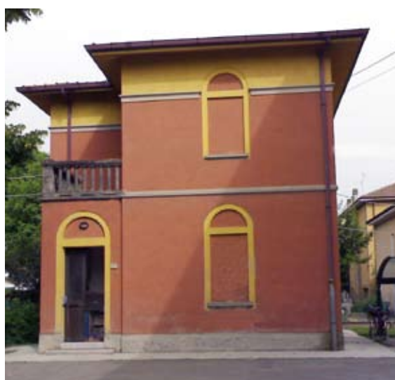
Sede amministrativa provvisoria dell'ASP