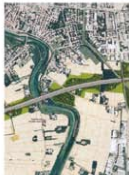
Cispadana e Asse viario

I prossimi passaggi nell'iter di realizzazione della Cispadana saranno la Conferenza dei Servizi (è lo strumento mediante il quale si assumono in un unico contesto tutti i pareri, autorizzazioni e nulla osta delle varie amministrazioni coinvolte) e la Valutazione di Impatto Ambientale dell'opera.