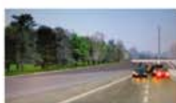
Boschi a fianco della Cispadana