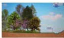
Opere di mitigazione di impatto ambientale

Sarà infine predisposto un progetto di salvaguardia ambientale del territorio lungo tutto il tracciato della Cispadana, attraverso fasce di tutela che dovranno essere recepite nei Piani Strutturali dei Comuni interessati.