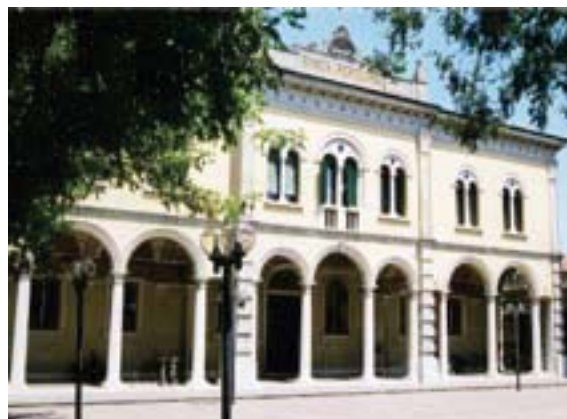
Dall’alto: inaugurazione mostra acquerelli e la sede della Banca Popolare di San Felice sul Panaro