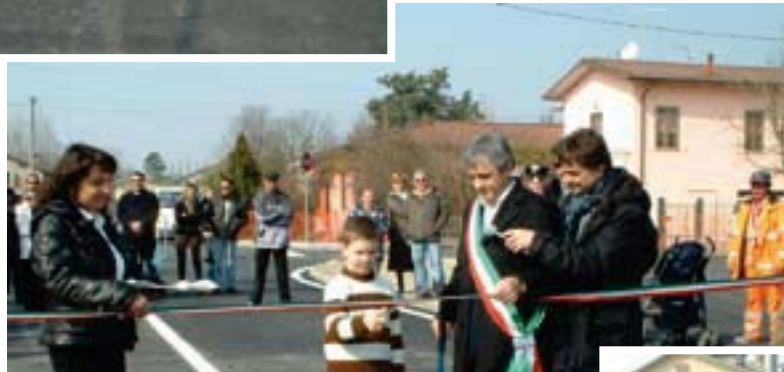
A lato e in alto: alcuni momenti dell'inaugurazione alla presenza delle autorità e dei cittadini