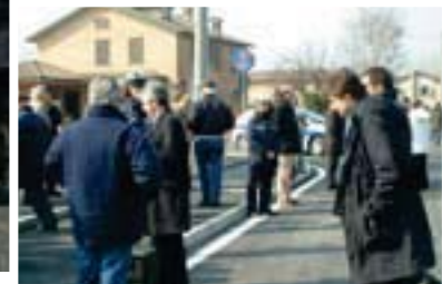
Il taglio del nastro inaugurale del sottopasso di via 1° Maggio - San Biagio