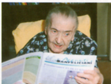
Le nostre due più anziane lettrici.