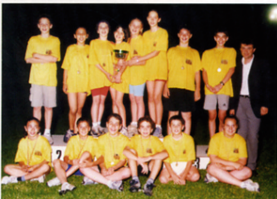
I nostri 14 bravissimi mini atleti.